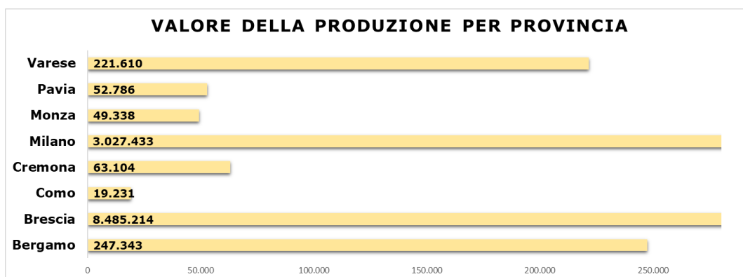
Figura 3 - Valore della produzione per provincia

Inoltre, il valore totale della produzione, nell'anno 2021, è pari a 12.166.059 (€/000), suddivisi per provincia come mostrato nel grafico a seguire.